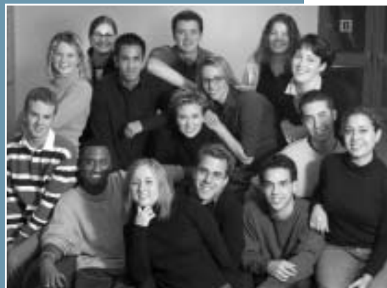
CASCO's executive committee