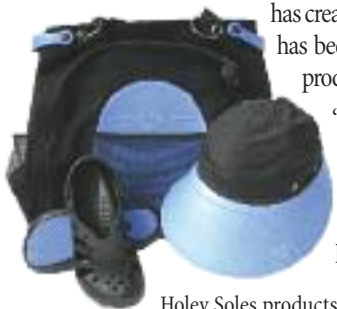
Holey Soles products